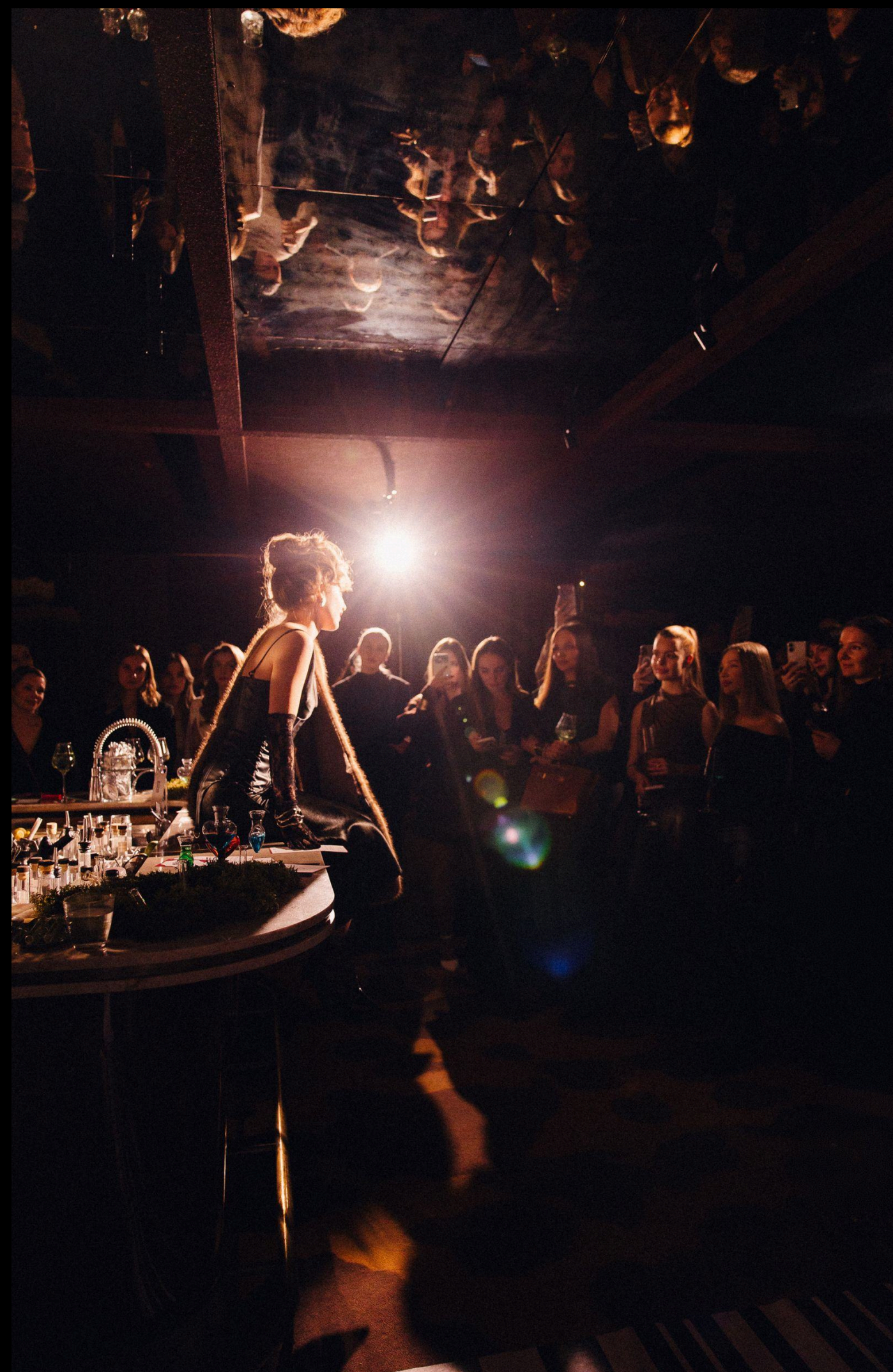
Презентация коктейля LOVE MIX от Wedding People & Segreto