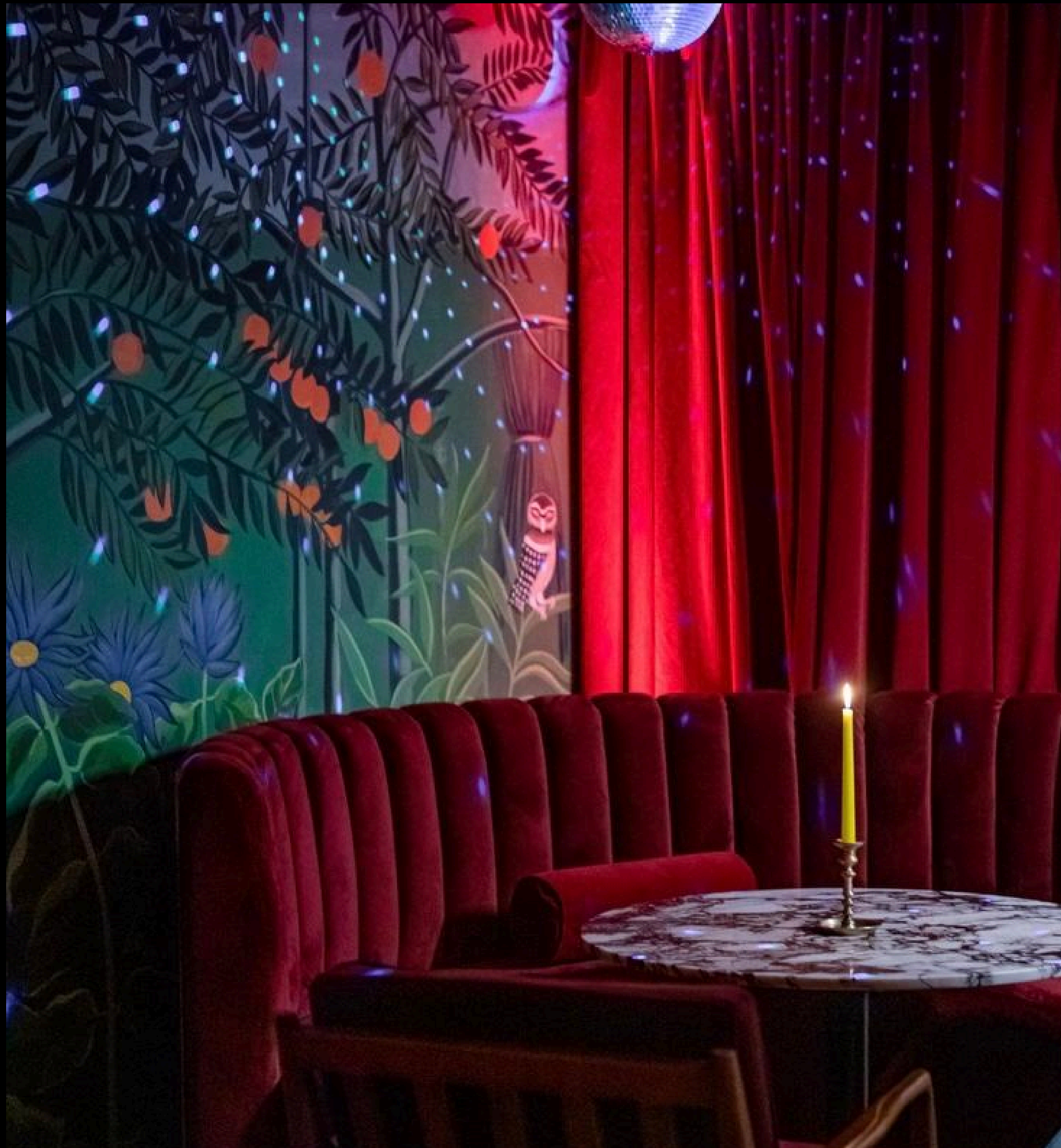
Схема зала Технический райдер Интерьер Мероприятия