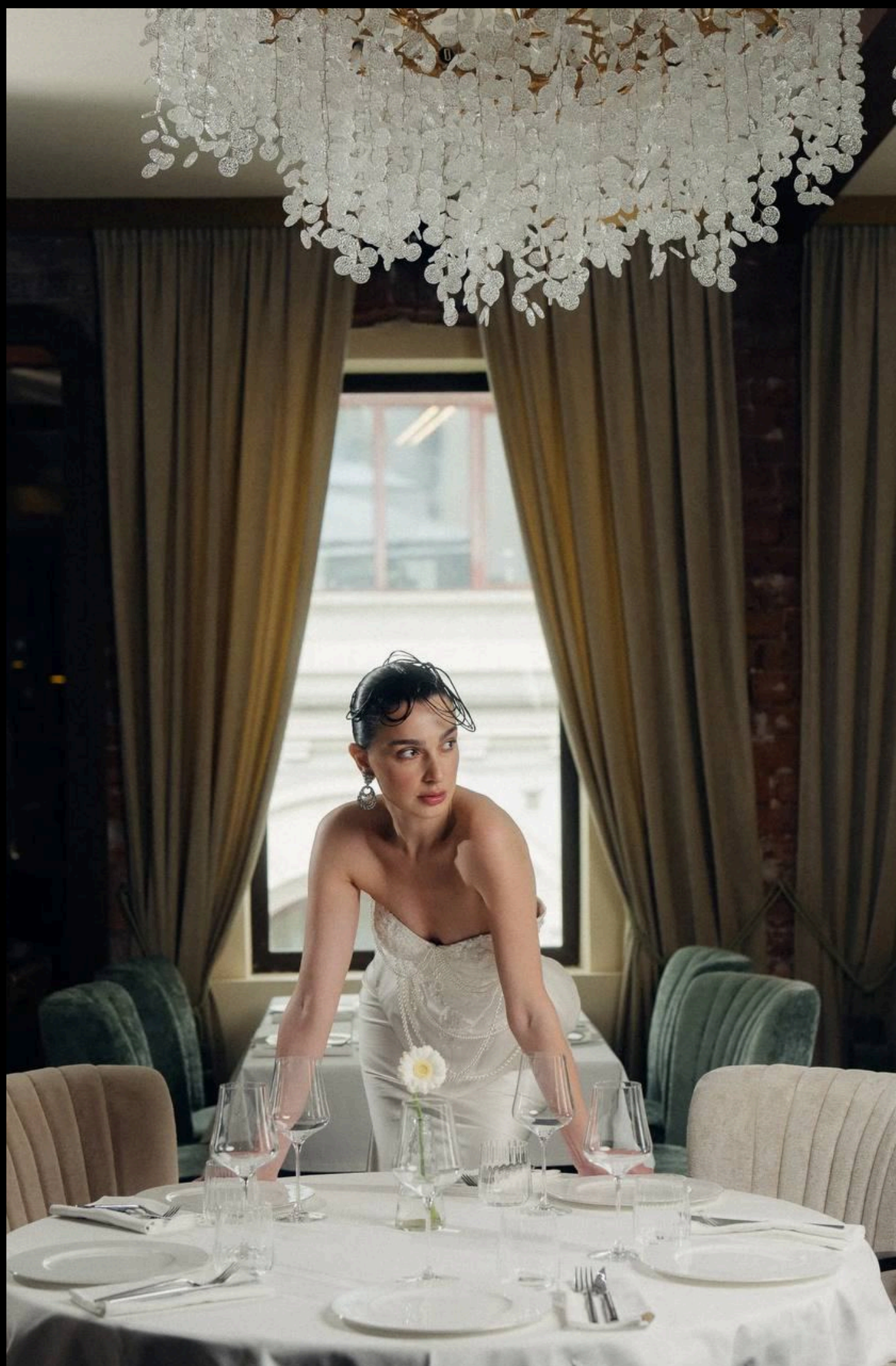
Утонченные свадьбы на Патриарших

Любимый проект event-организаторов для проведения камерных свадеб, личных дней рождений, партнерских мероприятий и вечеринок.