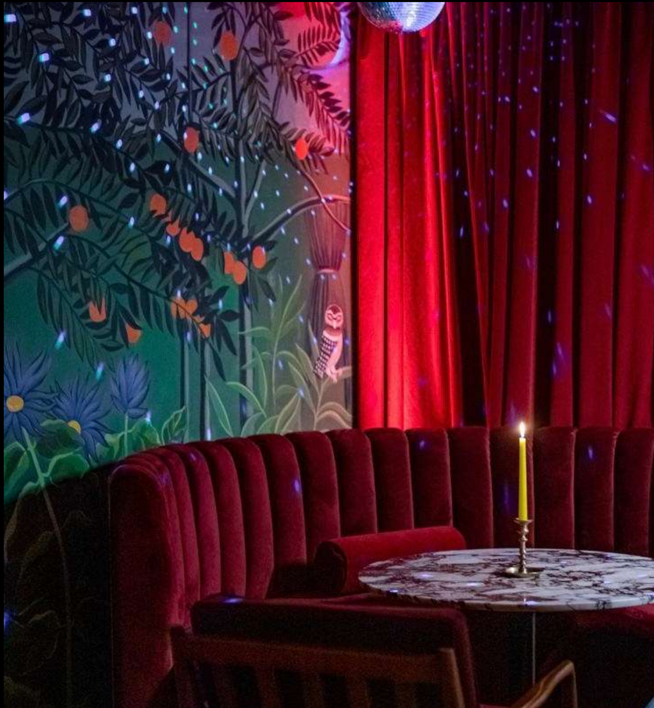
Схема зала Технический райдер Интерьер Мероприятия