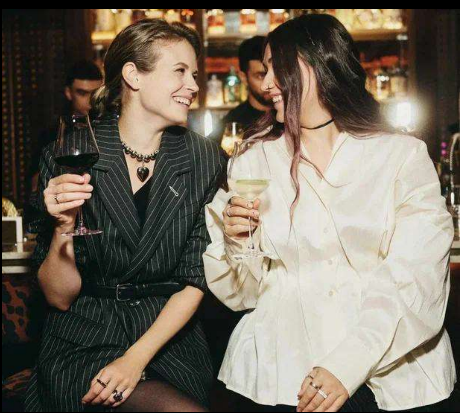
Посмотреть фотографии с Дней Рождения в Segreto